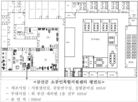
소공인복합지원센터 구축 대상지 도면